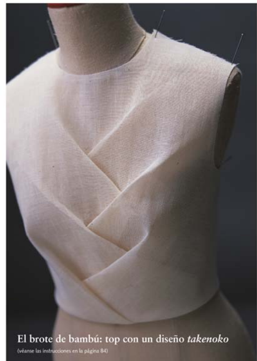
El brote de bambú: top con un diseño takenoko (véanse las instrucciones en la página 84)