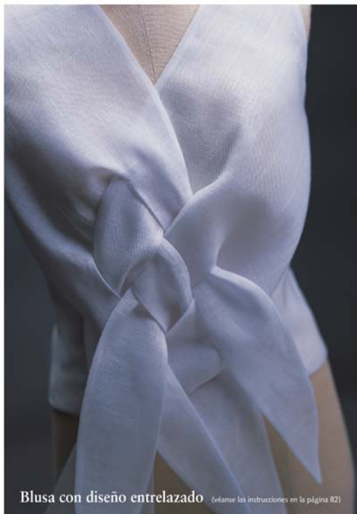
Blusa con diseño entrelazado (véanse las instrucciones en la página 82)

Traducido a diversos idiomas, Pattern Magic ha adquirido una extraordinaria fama internacional, y se ha convertido en el punto de partida obligado para que los estudiantes, profesores y profesionales de la moda experimenten con diseños modernos y atrevidos.