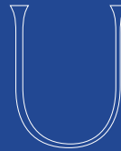
Injuria, Sandrine Nugue, 2019