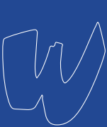
Choc, Roger Excoffon, 1955