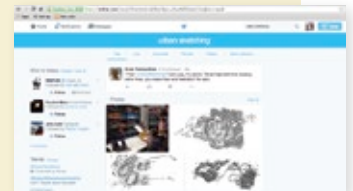
Flickr (arriba) y Twitter (abajo)