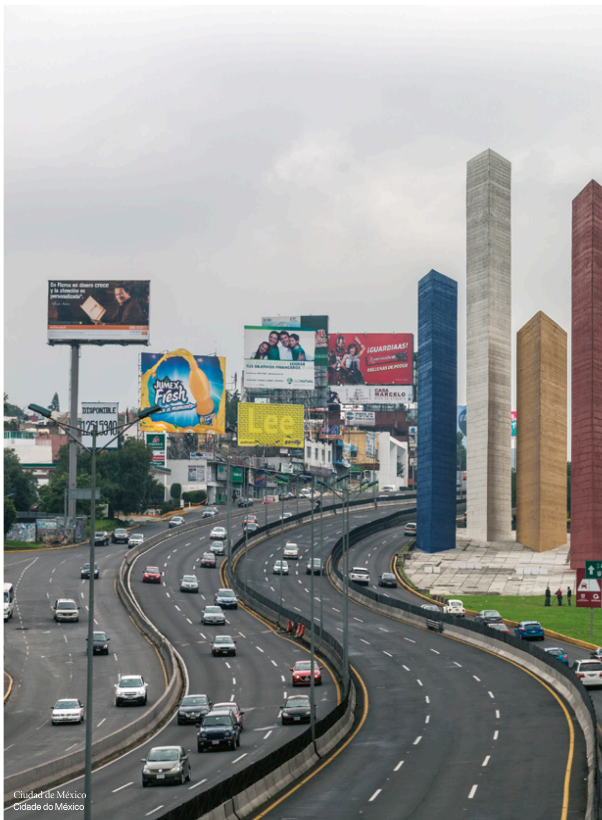
Ciudad de México Cidade do México