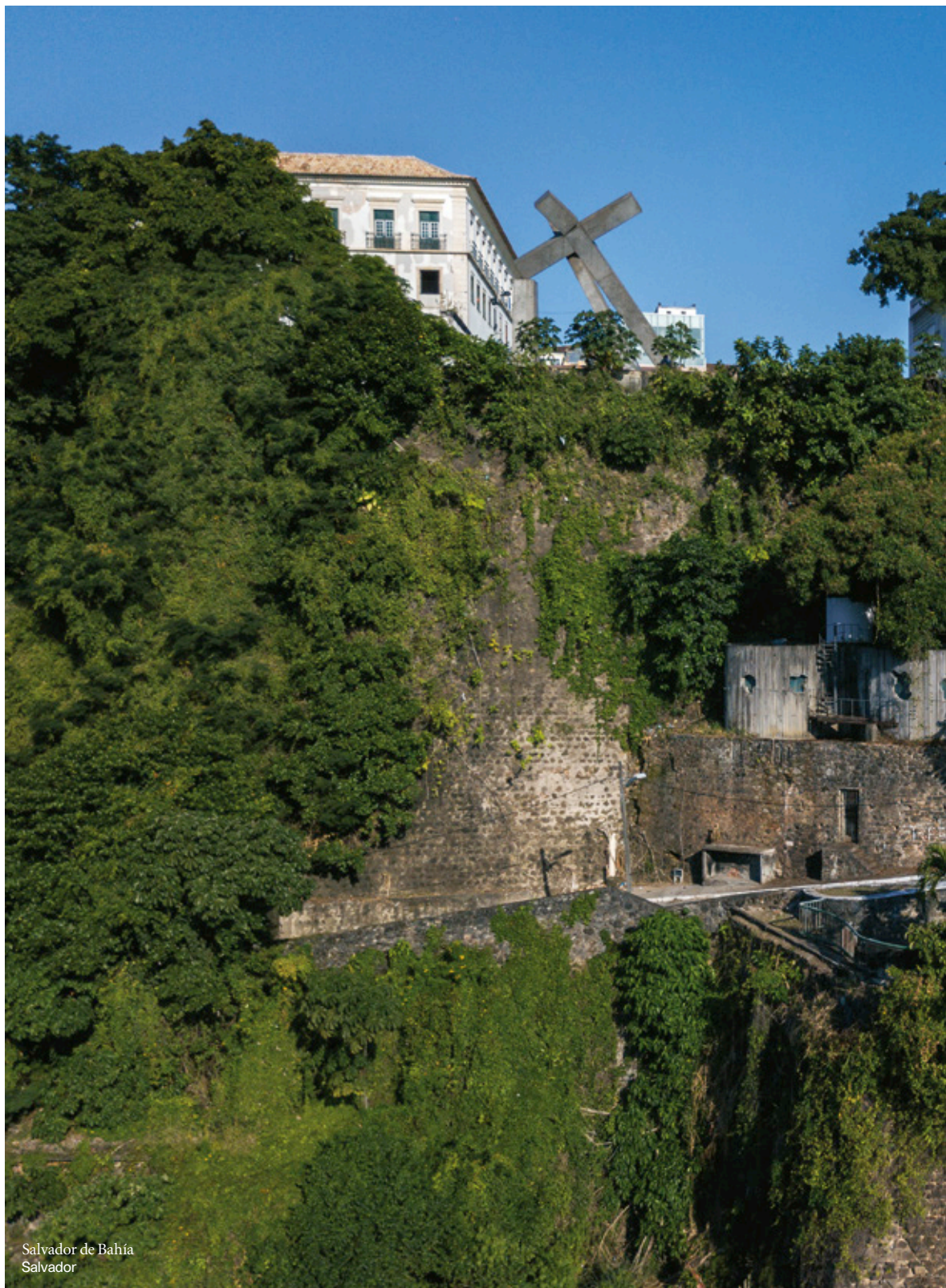
Salvador de Bahía Salvador