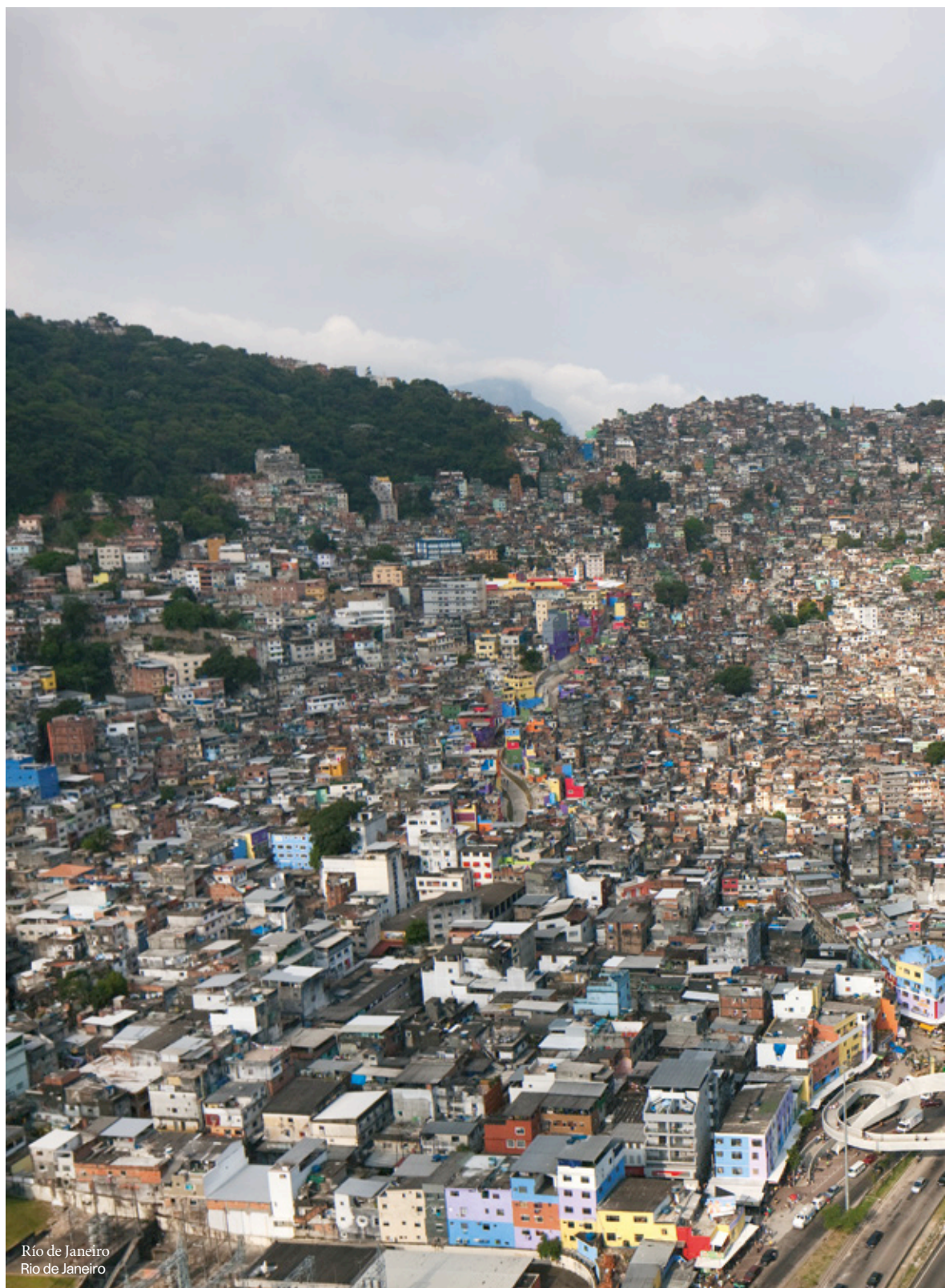
Rio de Janeiro Rio de Janeiro