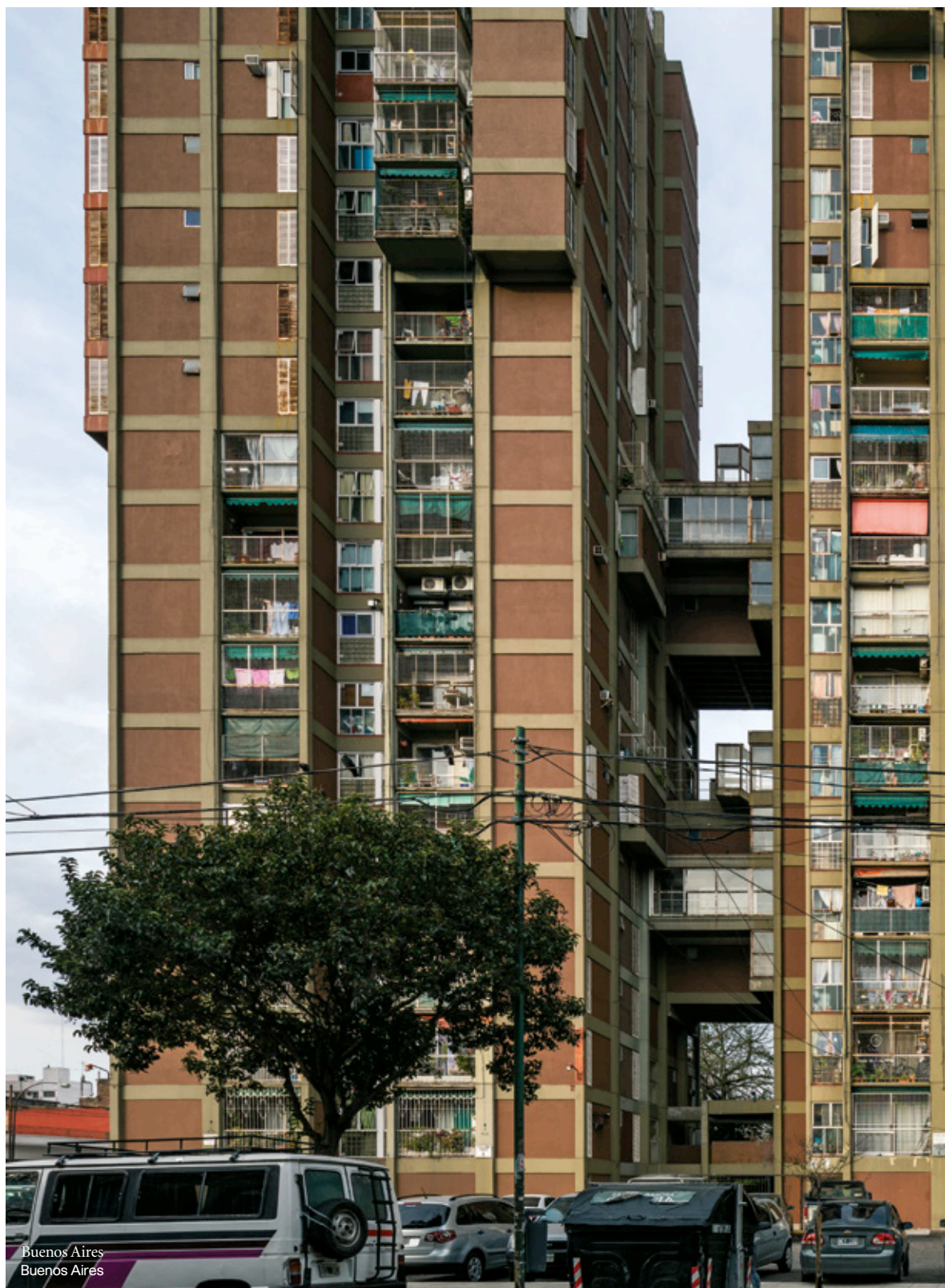
Buenos Aires Buenos Aires