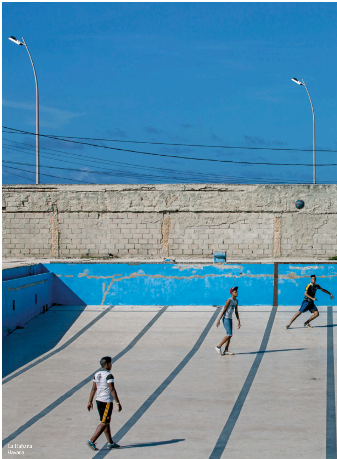
La Habana Havana